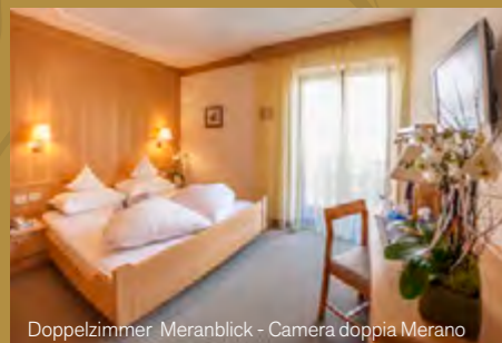
Doppelzimmer Meranblick - Camera doppia Merano