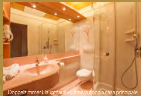
Doppelzimmer Haupthaus - Camera doppia casa principale